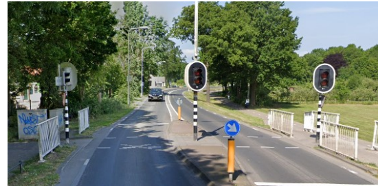
Afbeelding 1: voorbeeld verkeerslicht snelverkeer