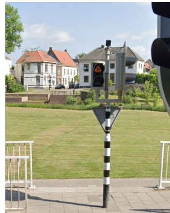
Afbeelding 2: voorbeeld verkeerslicht fietsverkeer

3 Wandbekleding fietstunnel Waarom vasthouden aan witte betegeling in de tunnelwanden? Sinds het gesprek met het Q-team is geweest is de ondertunneling bij Station Driebergen-Zeist geopend, waar we hebben kunnen zien dat het gebruik van natuursteen enorm kan bijdragen aan de landelijke en lokale natuur uitstraling. Waarom zo vast blijven houden aan die witte tegels, terwijl er voor het dorp Maarsbergen een passend beeld ontstaat?