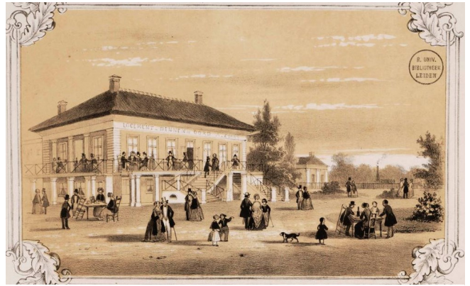
Logement Dennenoord omstreeks 1850.

Verspreid in de grond langs de Stationsweg vonden zijn scherven van een bord gemaakt van wit aardewerk. Op de onderkant was een merkteken aangebracht van de Fl.U.V., wat staat voor Flieger Unterkunfts Verwaltung ), de organisatie die tijdens de Tweede Wereldoorlog de logistiek en onderdak voor de Duitse luchtmacht (Luftwaffe) regelde. Dit merkteken bestaat uit een adelaar met hakenkruis in zijn klauwen. De letters FL.U.V. staan aan weerszijden van het hakenkruis; Fl. links en U.V. rechts. Het bord is gemaakt in 1942. Deze borden werden gemaakt in de Porzellanfabrik Heinrich Winterling te Maktleuthen en Felda Rhön te Stadtlengsfeld in Duitsland. Deze scherf vormt een tastbare herinnering aan een duistere periode van onze geschiedenis.