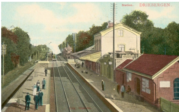
Station Driebergen 1905-1910.

Van 2017 tot 2020 wordt gebouwd aan een splinternieuw station Driebergen-Zeist. De hele omgeving gaat op de schop waarbij het streven naar bereikbaarheid, veiligheid en duurzaamheid belangrijke drijfveren zijn. De bouwput gunde archeologen een kijkje in het verleden. Een verleden dat teruggaat tot 17 juli 1846. Op die dag werd station Driebergen feestelijk geopend.