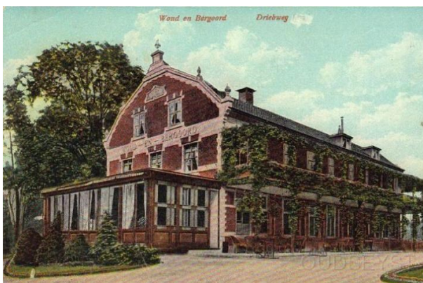
Logement Woud en Bergoord omstreeks 1906.