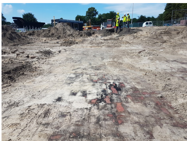
Fundamenten van het hotel uit de negentiende eeuw.