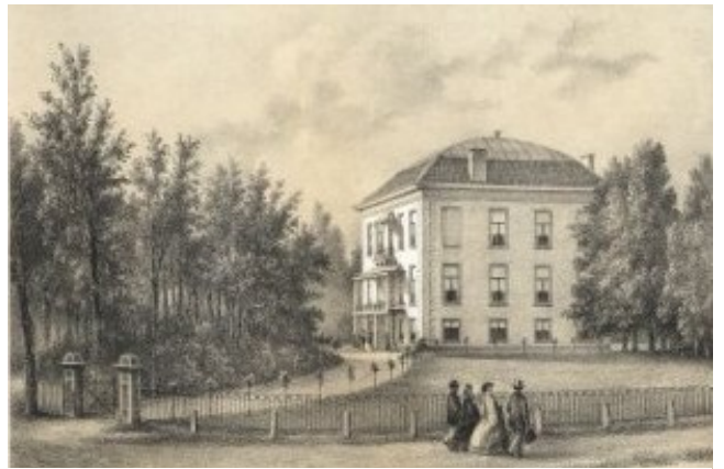
Rose Villa omstreeks 1865.