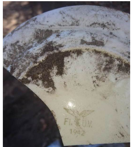
Naast het station is een scherf van een bord gevonden dat is gemaakt voor de Duitse Luchtmacht in 1942.