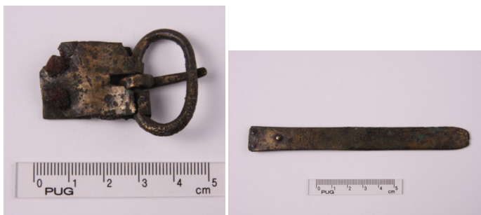
Bronzen gesp (links) uit de periode 600-750 na Chr. gevonden in 1931. Ook is er een bronzen riemtong (rechts) gevonden. De riem of gordel zelf zal van leer zijn gemaakt en is in zijn geheel vergaan (Foto: PUG).

Dit gegeven werd bevestigd toen in de jaren zestig riolering werd aangelegd in de Bentincklaan. Tijdens de werkzaamheden werden verschillende urnen met as en een skeletgraf aangetroffen.