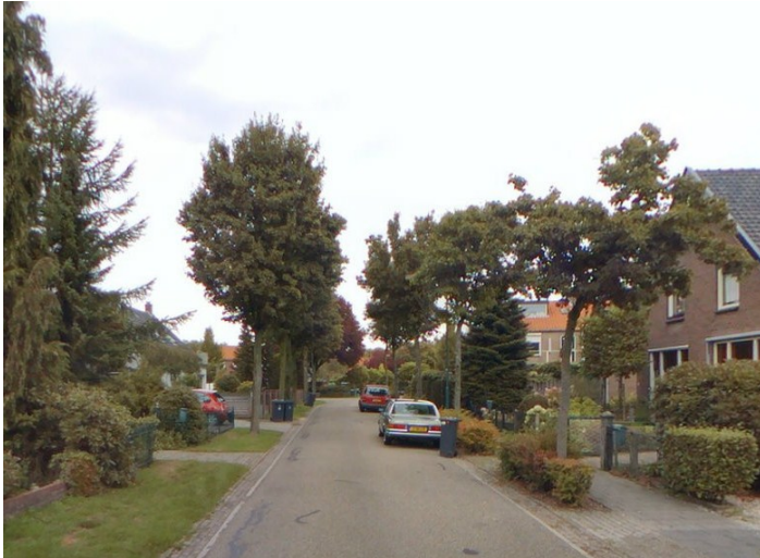
Zicht op de Bentincklaan richting het noorden in 2013