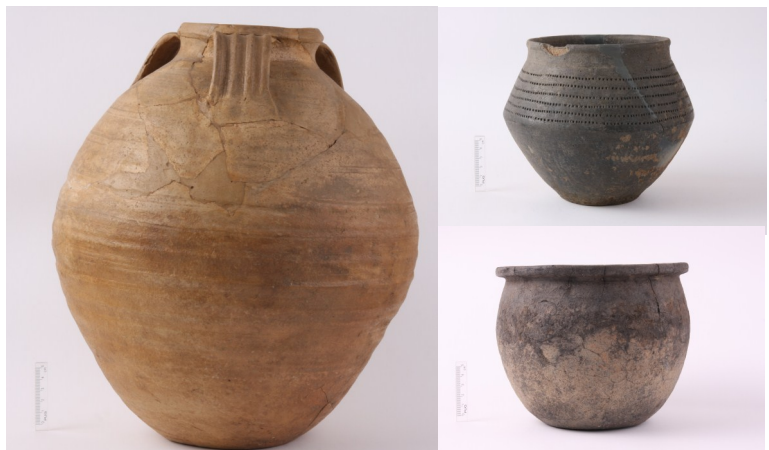
Urnen van de Bentincklaan gevonden door aannemer Spijkhoven in 1931. Vaatwerk van uiteenlopende aard werd gebruikt als laatste rustplaats.