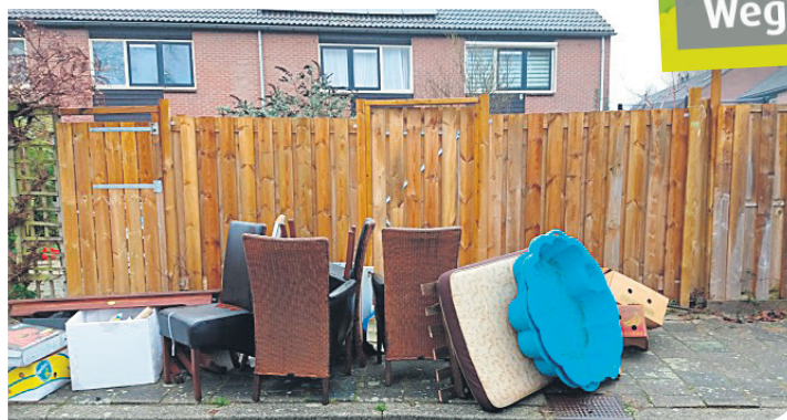
Geen grofvuil, maar grof afval dat prima gescheiden en gerecycled kan worden!